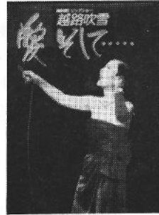
越路吹雪 愛そして (CD)

野坂昭如氏の代表作である「火垂るの墓」(昭和42年直木賞受賞)を原作として作りあげた劇場用長編アニメーション。