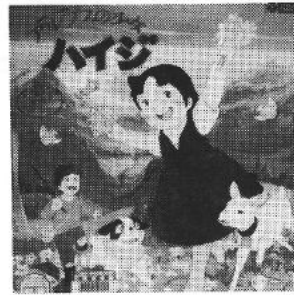
アルプスの少女ハイジ (LD)